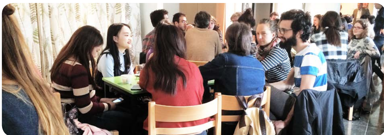
Engagerat samtal vid ett av Dödscaféerna

JAG UNDRAR OM Dödscaféerna kan bidra till att den lilla flickan som ville bli en mumie som vuxen vågar närma sig, tala om och ta itu med konsekvenserna av den minskande glaciären? Är döden genom klimatförändringar likadan som annan vanlig död? Sedan kom funderingar om svårigheten att möta död genom klimatförändring var ett för stort semantiskt hopp till den vanliga döden och om de politiska tankarna alls hängde ihop. Oavsett dessa tveksamheter uppfattar jag Dödscaféerna som något meningsfullt för deltagarna, i första hand för deras egen relation till döden, och bara det är positivt.